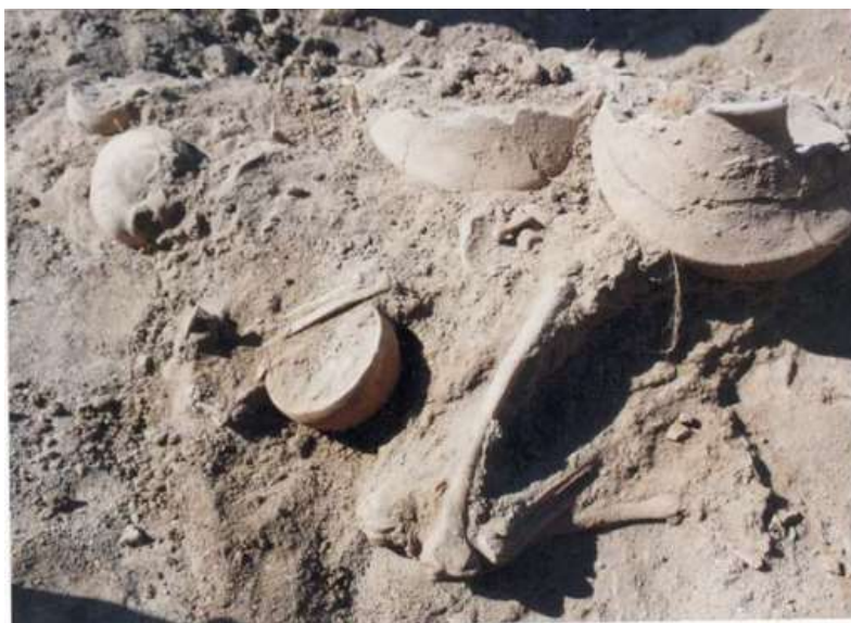
اسکلت کوریجان [6]

استخوانهای کوچک، ظریف یا شکننده با کمک قلم موی کوچک یا وسایل و ابزار دندانپزشکی پاک گردید. به منظور تثبیت وضعیت استخوانها و جلوگیری از هوازدگی با محلول پارالوئید ۲۵٪ پوشش داده شد. نحوه جا به جایی اسکلت انسانی از محوطه باستانی به گونهای بود که بدون آنکه استخوانها با دست برداشته شوند و در داخل جعبه یا محفظه مخصوص نگهداری استخوان قرار گیرند، با رعایت اصول فنی اسکلت با همان بستر اولیه به موزه هگمتانه انتقال یافتند. در موزه هگمتانه تدابیری اتخاذ شد تا مجموعه استخوانها مرمت کامل شوند. [1] در این پژوهش که براساس مطالعات استخوان شناسی انجام گرفته، جنسیت اسکلت زن تشخیص داده شد و سن تقریبی آن بر پایه جمجمه و تغییرات سنی در مندیبل یا فک تحتانی، انسان بالغ و بزرگسال بوده است. [6]