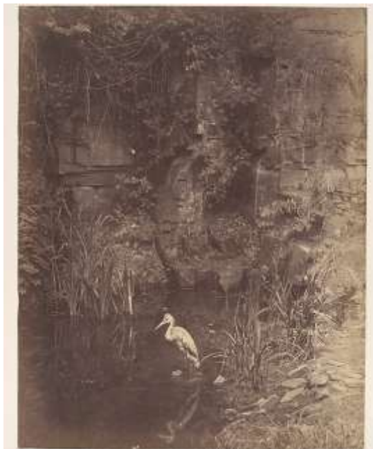
Piscator No. II, by John Dillwyn Llewelyn,

یکی از اولین عکسهای شناخته شده از حیوانات در سال ۱۸۵۶ توسط جان دیلوین لوولین از یک حواصیل گرفته شده است.