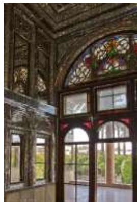
تصویر ۲. «تالار آینه» باغ نارنجستان قوام، شیراز، ۱۳۸۷.