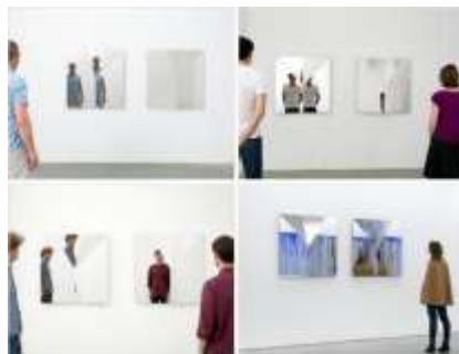
نصویر ۱. آثار Jeppe Hein در نمایشگاه ALL WE NEED IS INSIDE، امریکا، قطعات استیل فوق العاده پرداخت شده (آینه قوی).

هنر مفهومی اساساً گونه‌ای از هنرهای تجسمی است و در آن مفهوم یا ایده موجود در اثر، بر زیبایی‌شناسی معمول و مواد به کار رفته برای خلق آن اولویت دارد. چرا که در هنر مفهومی، «ایده‌ی با مفهوم» مهم‌ترین جنبه‌ی کار است. به عبارت دیگر در بیان هنری، مفهوم است که نقش اصلی را ایفا می‌کند. نخستین تظاهراتی که منجر به شکل‌گیری (جنبش) هنر مفهومی شد، به سال ۱۹۶۰م. باز می‌گردد که در غرب اتفاق افتاد و بر این اساس استوار بود که مفهوم اثر هنری دارای اهمیت است و شکل