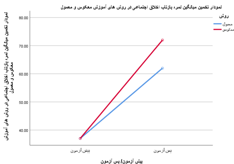
نمودار ۱: تخمین میانگین نمرات نشاط ذهنی در روش‌های آموزش معکوس و معمول

با توجه به جدول ۶ تاثیر جداگانه روش‌های آموزش ( F=382/91 , Sig=0/00 ) بر نمره پیشرفت تحصیلی دانش‌آموزان معنی‌داری می‌باشد یعنی به لحاظ آماری، میانگین نمره پیشرفت تحصیلی در بین روش‌های آموزش متفاوت می‌باشد.