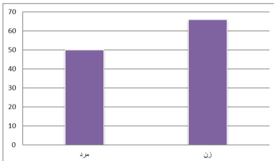
نمودار (۱) - درصد فراوانی نمونه مورد مطالعه بر تفکیک جنس