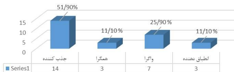
فراوانی سبک های یادگیری بین دانشجویان شرکت کننده در پژوهش

شکل ۳. نمایش نموداری فراوانی سبک های یادگیری بر اساس پرسشنامه کلب بین دانشجویان شرکت کننده در پژوهش