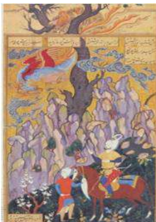
تصویر ۳. دیدار سام و زال در لانهٔ سیمرغ، شاهنامه شاه اسماعیل دوم (حسینی‌راد، ۱۳۸۴: ۳۱۱)

برای سهروردی اساس کمال، توجه تام به «نورالانوار» و انقطاع به سوی اوست و همه خلق‌ها آنگاه دارای ارزش هستند که انسان را در راه قرب الهی یاری رسانند. یک عارف بر اثر سیر و سلوک و مجاهده، از مرز حدود قیود شخصی می‌گذرد و به حقیقت مطلق و نامحدود دست می‌یابد و با آن متحد گشته، سرانجام در آن فانی می‌گردد. فانی فی‌الله به معنای از خودرهایی و بیرون آمدن از تمامی تعلق‌ها و وابستگی‌های مادی و بشری و بقا به صفات سرمدی است (سهروردی، ۱۳۷۵، ج ۲: ۲۷۱). در نگارگری با توجه به این‌که غایت‌گرایی از منظر سهروردی انقطاع و توجه کامل به «نورالانوار» است، این توجه به اصل را می‌توان در شاخص نمودن فرمی و رنگ‌بندی‌ها و نورپردازی‌های نگارگر با توجه به عناصر زیبایی‌شناسی اسلامی بررسی نمود (کفشچیان‌مقدم و یاحقی، ۱۳۹۰: ۶۹). چنانچه در تصویر ۳ دیده می‌شود، نورپردازی و رنگ‌بندی‌ها کاملاً در جهت غایت اثر (دیدار سام و زال) به کار گرفته شده است.