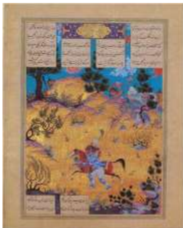
تصویر ۵. جنگ رستم با ارژنگ دیو، شاهنامه طهماسبی (حسینی‌راد، ۱۳۸۴: ۲۵۷)

در مورد نگارگری نیز باید گفت: «در هنر اسلامی، زیبایی و جمال بهترین رهبر انسان به سوی فضائل اخلاقی و منتهی به حقیقت است. بنابراین زیبایی نمودی بر کمال است؛ کمال جنبه درونی و باطنی و جمال جنبه بیرونی و ظاهری حقیقت است» (سیاه کوهیان، ۱۳۹۱: ۴۸) «زیبایی و هماهنگی که در الگوهای هندسی مشاهده می‌شود، یک نظم بالاتر و عمیق است که قوانین کیهانی را منعکس می‌کند. انسان روحانی درصدد کشف الگوهای هندسی در جهت رسیدن به خداست» (حجازی، ۱۳۸۷: ۲۵-۲۶). پس استفاده از نقوش هندسی و ریزه‌کاری‌های تزئینی در جهت کمال‌خواهی در نگارگری نیز مشهود است. می‌توان در تصویر ۵ ریزه‌کاری‌ها و نقوش تزئینی در جهت رسیدن به کمال نگاره را دریافت کرد.