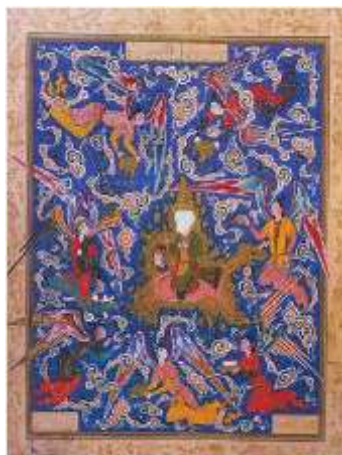
تصویر ۶. معراج پیامبر، (آزند، ۱۳۸۴: ۲۱۸)